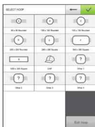
Selezione del telaio e centro automatico per evitare errori