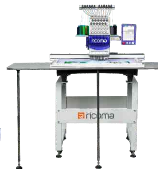
Telaio grande con tavola e sostegno