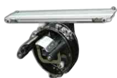
Pinza per cappellini doppia