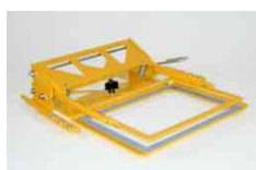
Telaio per materiali spessi e rigidi