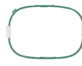
1 da 540x360 mm 1 da 400x400mm