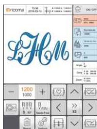
Traccia il ricamo con un click