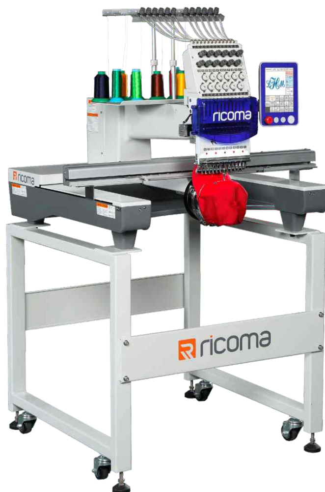
ricoma SWD 1501 8S THINK BEYOND

Macchina monotesta per ricamo computerizzata con 15 aghi, tagliafilo e cambio colore automatico, ideale per il ricamo di polo, t-shirt, cappellini e tanti altri articoli promozionali.