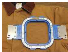
Telai magnetici per indumenti spessi