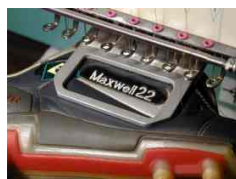
Telaio per scarpe