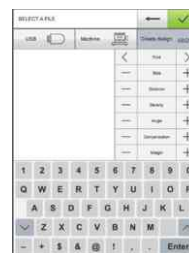
Creazione di scritte direttamente sulla macchina